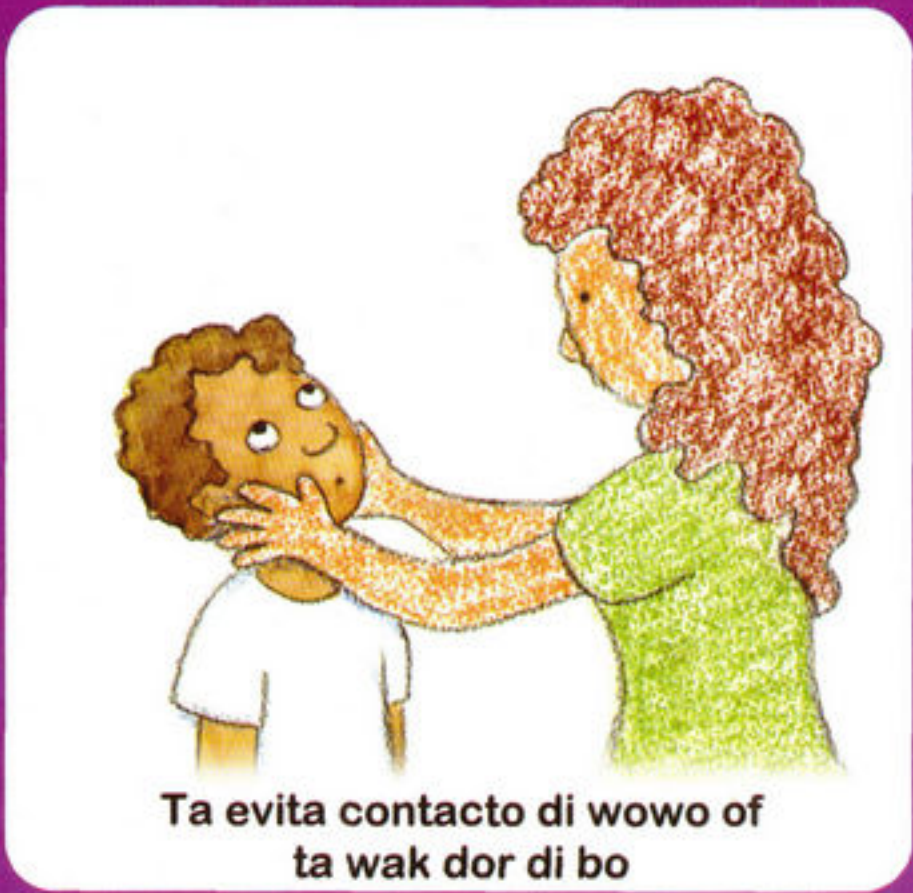
Ta evita contacto di wowo of ta wak dor di bo